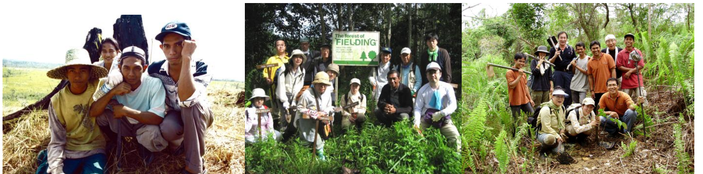
東カリマンタンバリックバパンチーク植林地 ムラワルマン大学演習林樹下植林地 オランウータンの森づくりサンボジャ現場