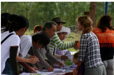
2011 年植林祭受付風景