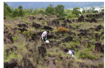
想いをこめて植林現場へ