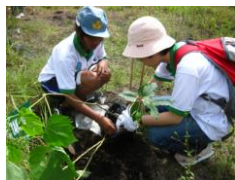
地元の高校生と植林