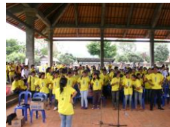
2011 年 12 月植林祭