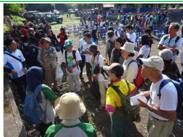
2013年植林祭受付風景