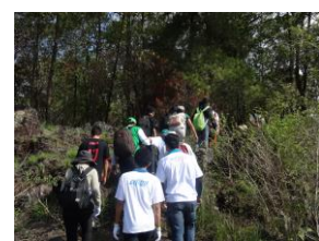
想いをこめて植林現場へ