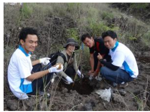
地元の高校生と植林